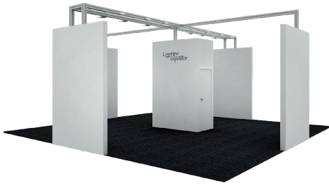
Ejemplo de stand PACK ISLA (48m 2 )