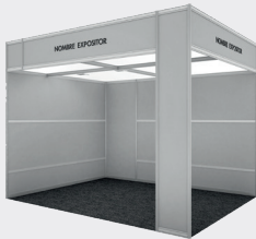
Ejemplo stand 12m 2 (4x3)