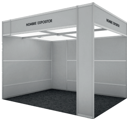
Ejemplo de stand modular PACK BASIC (4x3)