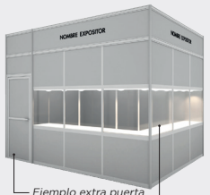
Ejemplo extra puerta Ejemplo extra vitrina